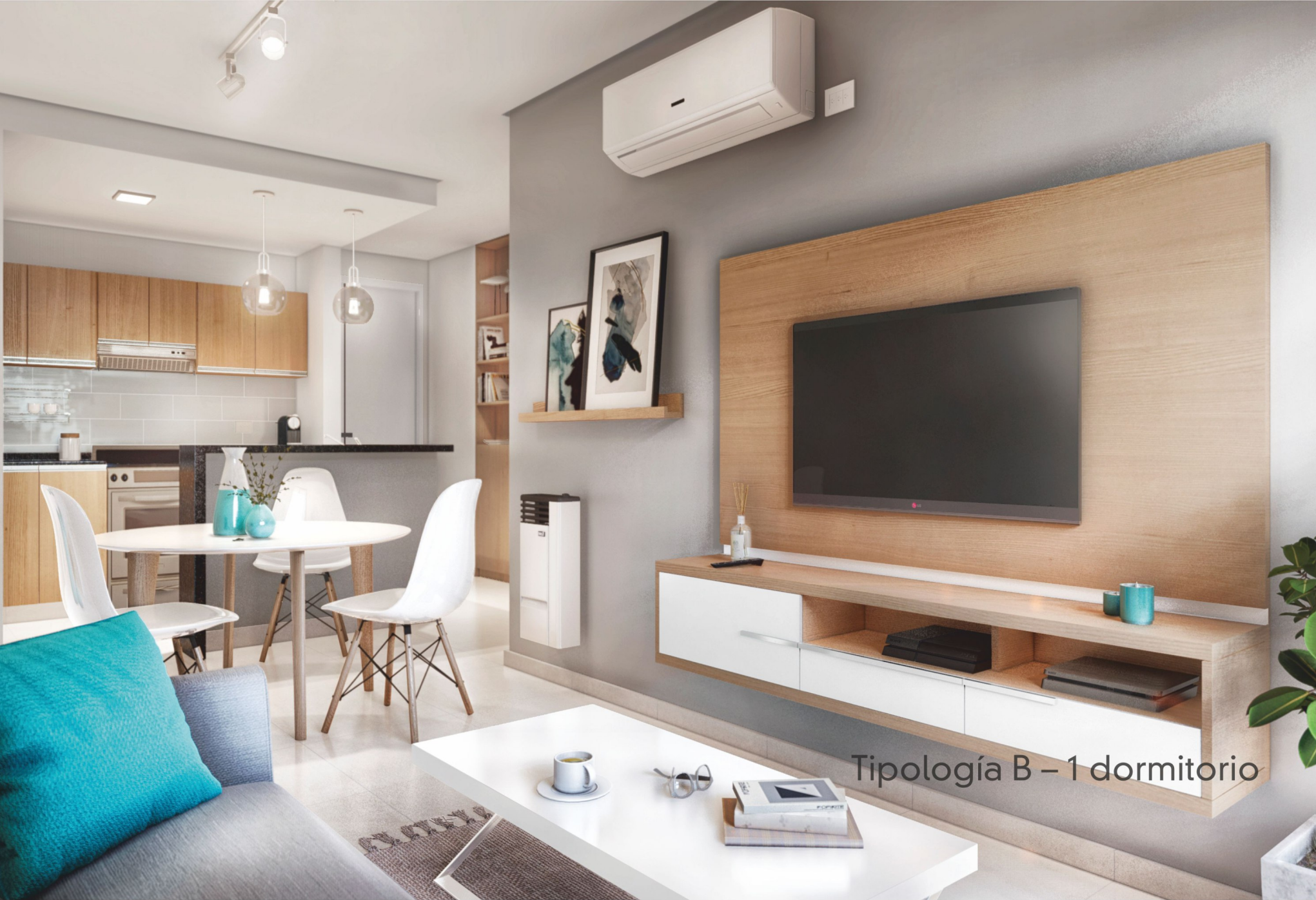
Tipología B – 1 dormitorio