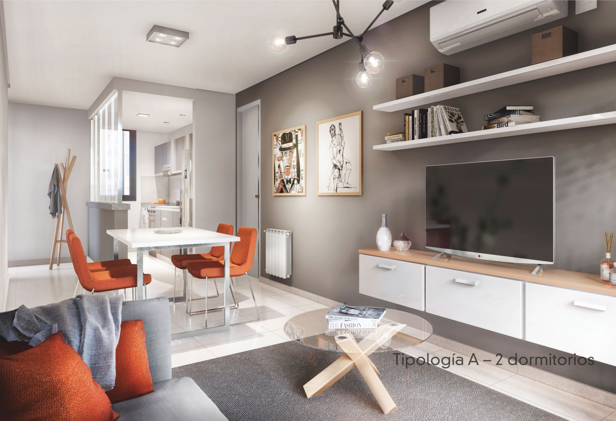
Tipología A – 2 dormitorios