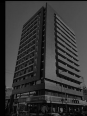
TORRE SOSNEADO 2